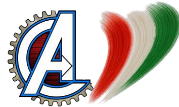
Tabella di Marcia: Campionato Nazionale Montagna CSI Torre de Busi 24 Maggio 2026 Organizzatore ASD Bike Avengers Partenza ore 10:00